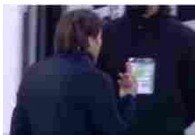
Il gestaccio di Conte alla panchina della Juventus che ha fatto infuriare Agnelli