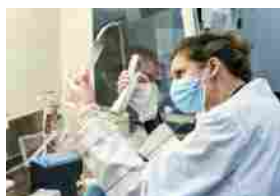
Coronavirus, identificata una nuova mutazione