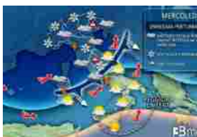
Maltempo, allerta meteo per quattro regioni