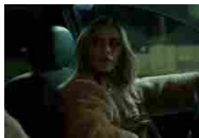
Speravo di mori prima, l'incontro tra Francesco Totti e Greta Scarano